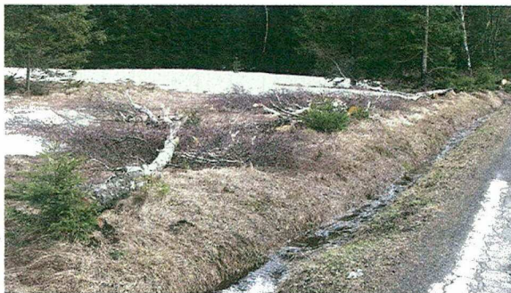
Padlé břízy na straně k Horní Blatné na úseku cca 100 metrů pod lesem od místa, kde je navrženo odbočení silnice II/221 na obchvat Horní Blatné.

2007 knihu Jak si tak píšu... Jak si tak kreslím a naposled J. Konečný dodal text v roce 2008 do knihy kreslíře J. Vaňka Humor není jenom smích... aneb Politika někdy k smíchu je.