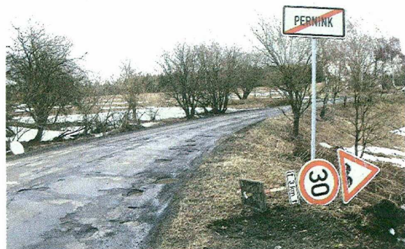
Konec obce Pernink - stav silnice se zanedbanou údržbou.

Autor je mluvčím občanského sdružení se sídlem v Horní Blatné